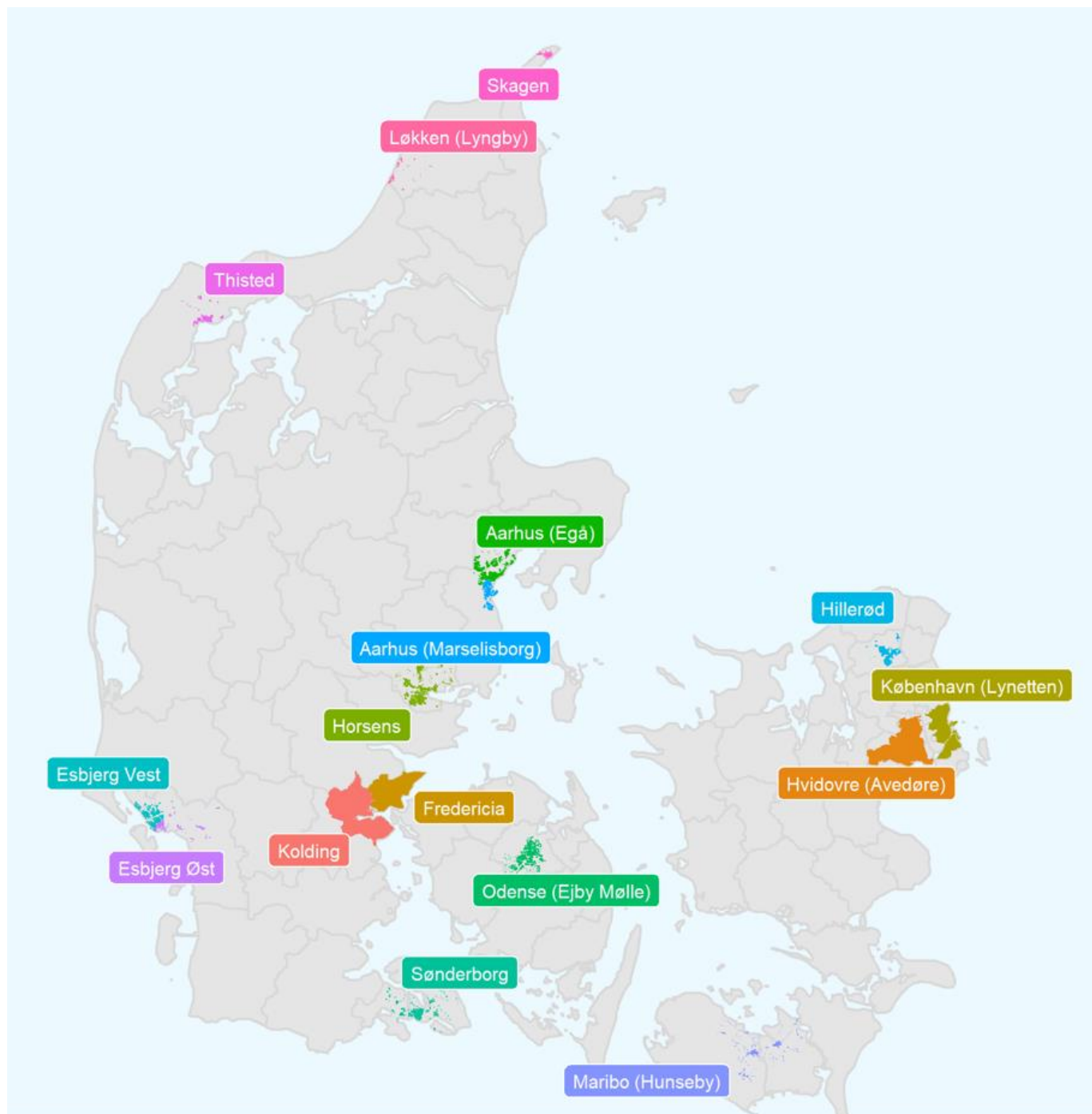
Kortet viser de 16 rensningsløg med tilhørende oplände, hvor spildevandsprøverne er udtaget fra.