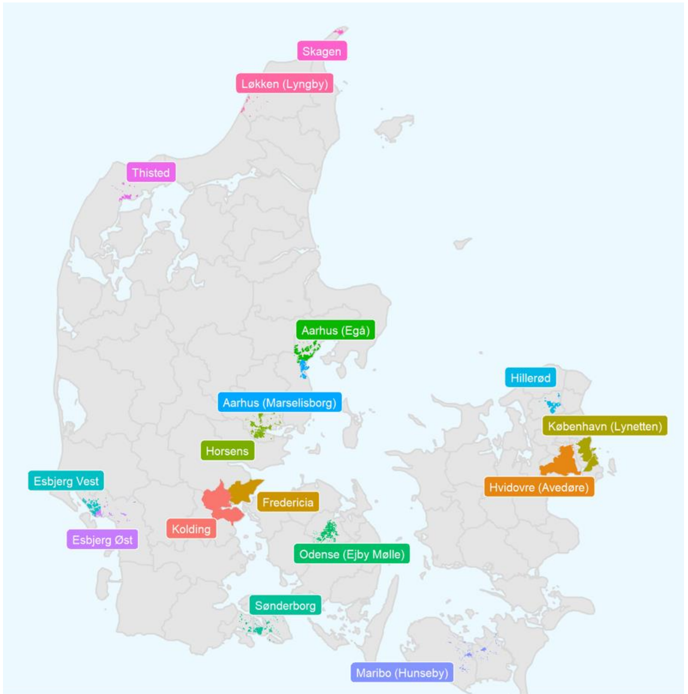
Kortet viser de 16 rensningsløg med tilhørende oplände, hvor spildevandsprøverne er udtaget fra.